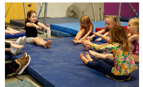
Eveil corporel 4 - 5 ans

Retrouvez toutes les infos sur nos activités sur