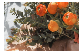
Atelier d'arts floral