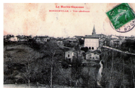
Histoire et Patrimoine