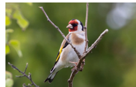
Nature et Environnement