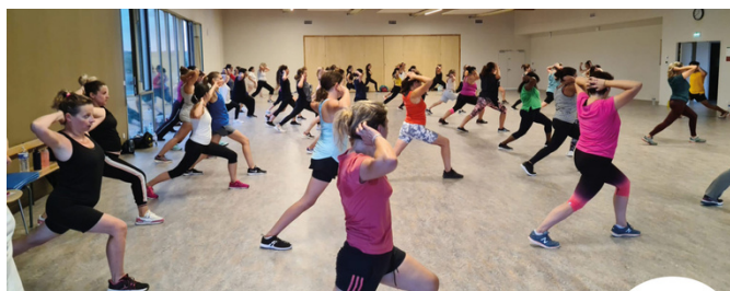
LA ZUMBA FAIT SA RENTRÉE À MONDONVILLE Reprise en grandes pompes !

Vous pouvez encore rejoindre nos 300 adhérents !